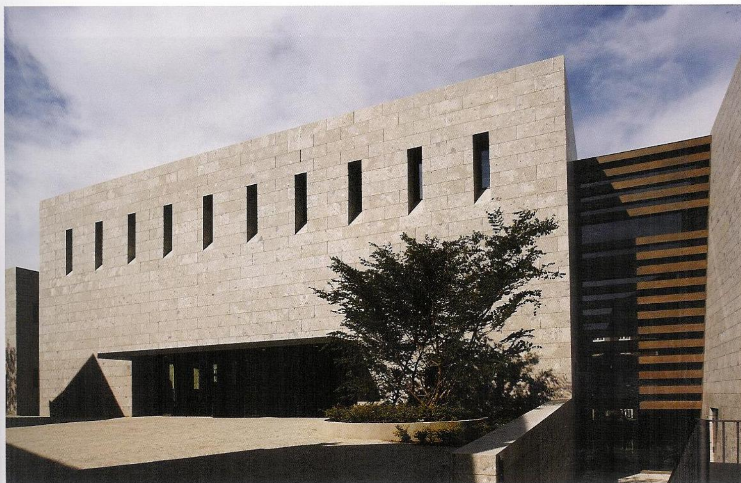
De ingang van het nieuwe Provinciaal Gallo-Romeins Museum, achter de OLV-basiliek van Tongeren. Rechts van het hoofdgebouw vormt de vroegere Allée Verte nu de aansluiting met het oude, gerenoveerde deel van het museum.

Daarom kozen we voor de gevel voor een bijzondere natuursteen, Ceppo, een Italiaanse kalksteen die wat weg heeft van beton met kiezel. Het materiaal past ook goed bij de silexstenen waaruit de basiliek is opgetrokken.