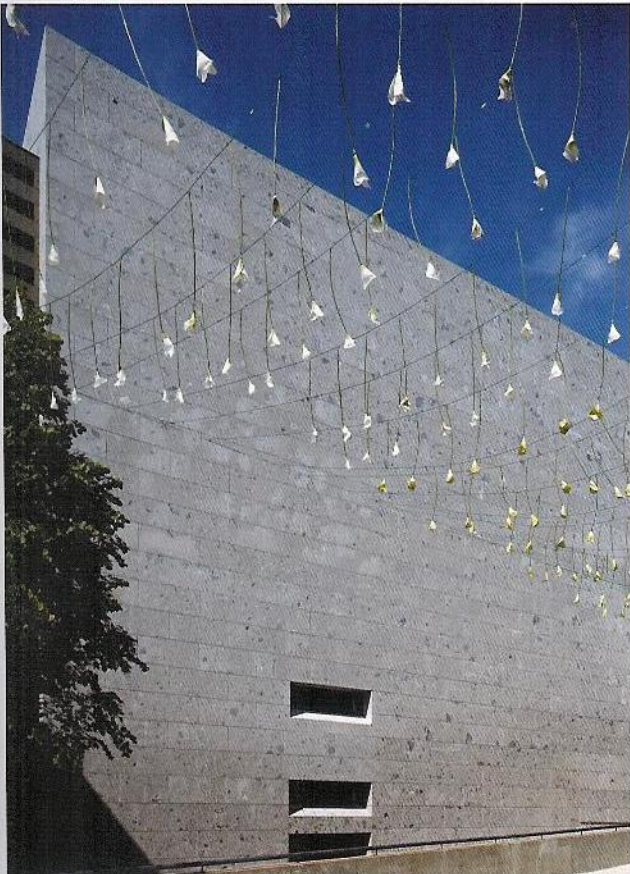
De zwarte ingang links leidt je naar de eerste museumzaal, de rode ingang rechts biedt toegang tot het nieuwe museumcafé, dat ingericht is door Creneau International

Het plein tussen basiliek en museum verbergt een groot, nieuw gedeelte van het museum, zoals lokalen voor kinderactiviteiten, eetzaal, toiletten, opslagruimtes voor museumstukken en vestiaire voor bezoekers. Via een put in de grond krijgen deze ruimtes ook daglicht. Jos Bijmens: "We hebben alle muren ter plaatse gestort, met stortklaar winterbeton - ook in de zomer gebruikt - uit de Ready Betoncentrale in Borgloon. Vooral omwille van de bleke kleur van dat Portland beton. Het ter plaatse storten van de 9 meter hoge wanden was een hele klus, omdat we veel aandacht besteed hebben aan de bekisting, bewapening en andere details." Logistiek bleek dit project ook een hele onderneming. Zo moest er 1 000 m 3 beton gestort worden, alleen al voor de vloerplaat. En dat op een moment dat er elders in de stad wegenwerken aan de gang waren en dat er ook in de basiliek grote werken werden uitgevoerd.