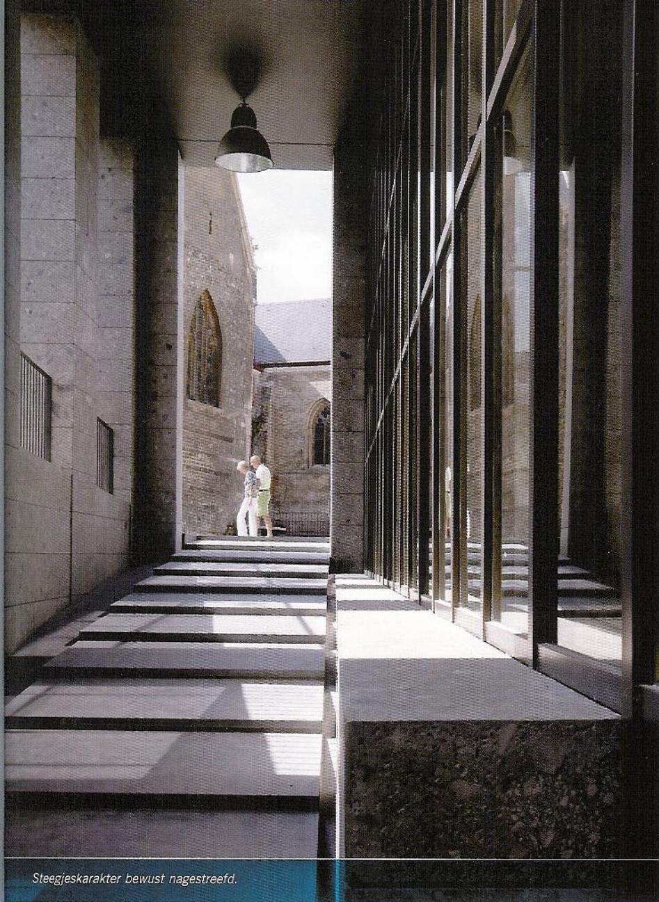
Steegjeskarakter bewust nagestreefd.