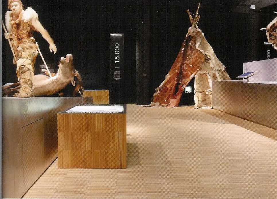
Taal teakhouten parket.